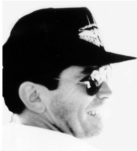
Fotografía sacada en 1991