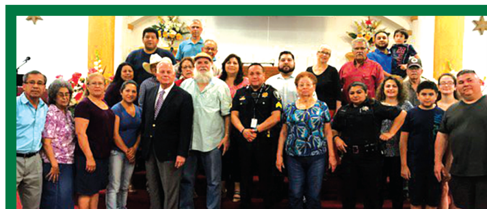
El Congresista Green se reunió con el Club Cívico de Fullerton en junio, y hablaron de la atención médica y varios temas que afectan la comunidad.

La economía en esta parte del país se está expandiendo rápidamente gracias al desarrollo de Eagle Ford y la cuenca del Permiano. Este proyecto de ley ayudará a asegurar que esta prosperidad económica sea compartida entre toda la comunidad. Estos empleos profesionales bien pagados estarán disponibles para nuestros estudiantes.