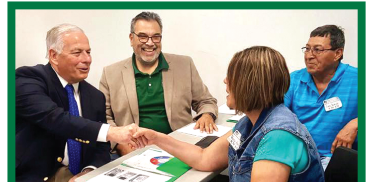
El Congresista Green saludando a los residentes del 29° Distrito de Texas durante el Día Anual de la Ciudadanía, que tuvo lugar en junio y en donde más de 70 miembros de la comunidad recibieron ayuda con sus trámites de ciudadanía.

Salvation Army Boys & Girls Club 2600 Aldine Westfield Houston, Texas 77093