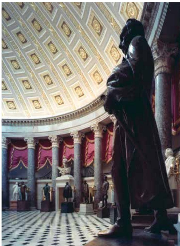
Hội trường cũ của Hạ viện bây giờ là Khu Trưng bày Điều khắc Quốc gia.

Phần xây dựng thêm mới nhất của Tòa nhà Capitol là Trung tâm Tiếp đón Khách thăm, được xây bên dưới sân East Plaza và hoàn thành vào năm 2008. Trung tâm này có khu triển lãm, nhà hát giới thiệu, một nhà hàng, các cửa hàng quà lưu niệm, đường ăn thông qua Thư viện Quốc hội và các cải thiện chức năng hoạt động của Tòa nhà Capitol.