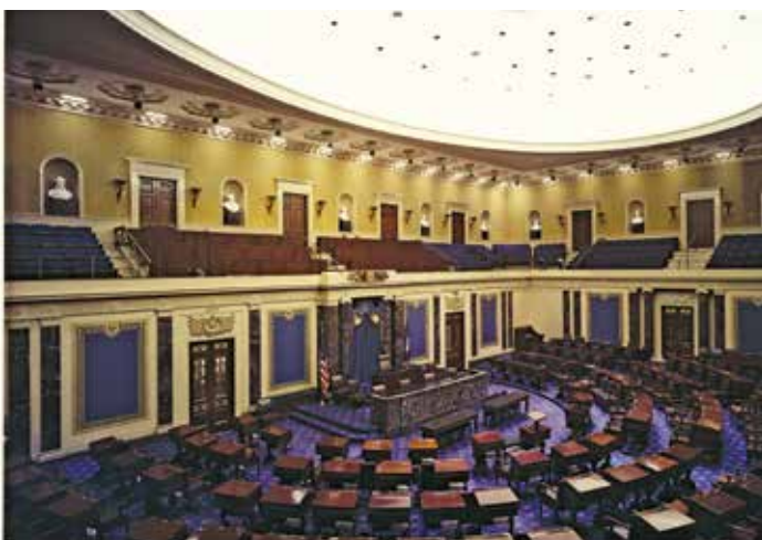
Phòng họp Thượng viện.

Nếu một dân biểu qua đời hoặc rời chức giữa nhiệm kỳ, một cuộc bầu cử đặc biệt được tổ chức để chọn người thay thế. Ngoài