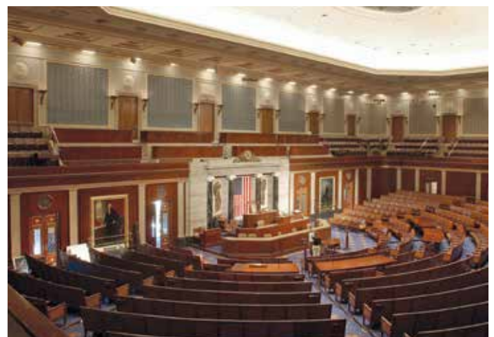
Phòng họp Hạ viện.