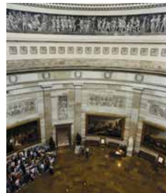
Khu Mái vòm Rotunda là một điểm nhấn trong chuyến thăm Tòa nhà Capitol Hoa Kỳ.

Các tour này miễn phí nhưng phải có vé. Vé đi tour có thể đặt trực tuyến trước tại www.visitthecapitol.gov , hoặc thông qua các văn phòng của thượng nghị sĩ hoặc dân biểu của quý vị, hoặc bằng cách gọi Văn phòng Phục vụ Khách thăm, số 202-226-8000. Một số vé đi tour trong ngày, không đặt trước, có thể nhận tại Trung tâm Tiếp đón Khách thăm.