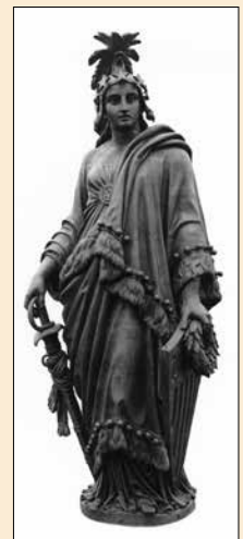
▲ Tượng thần Tự do trên đỉnh mái vòm.