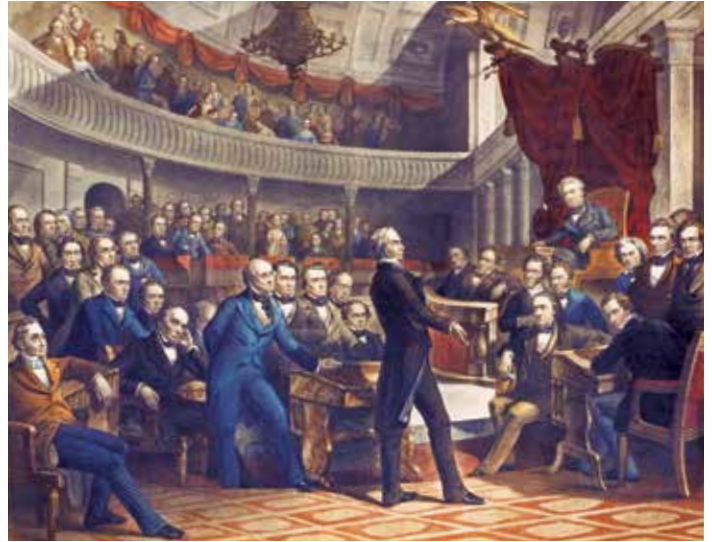
Thượng nghị sĩ Henry Clay phát biểu tại Phòng họp Thượng viện cũ nhân dịp có thỏa hiệp năm 1850 giữa các tiểu bang có và không có nô lệ.

Tính đến năm 1850, rất nhiều tiểu bang mới gia nhập Liên bang đến độ các phòng họp của Hạ viện và Thượng viện không đủ chỗ chứa. Mọi người quyết định nới rộng Tòa nhà Capitol bằng cách xây thêm một cánh lớn vào hai đầu của tòa nhà nguyên thủy. Năm 1851, Daniel Webster, từng phục vụ trong cả hai viện Quốc hội,