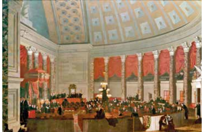
Tranh mô tả buổi họp của Hạ viện trong Hội trường cũ do Samuel F.B. Morse vẽ, thuộc bộ sưu tập của Viện Bảo tàng Nghệ thuật Quốc gia.

Hãy giúp bảo tồn kho tàng nghệ thuật của Tòa nhà Capitol cho các thế hệ tương lai. Xin thưởng lãm các bức tranh và tác phẩm điêu khắc, nhưng đừng chạm tay vào.