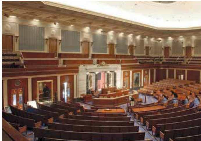
የሕዝብ እንደራሴዎች ምክር ቤት