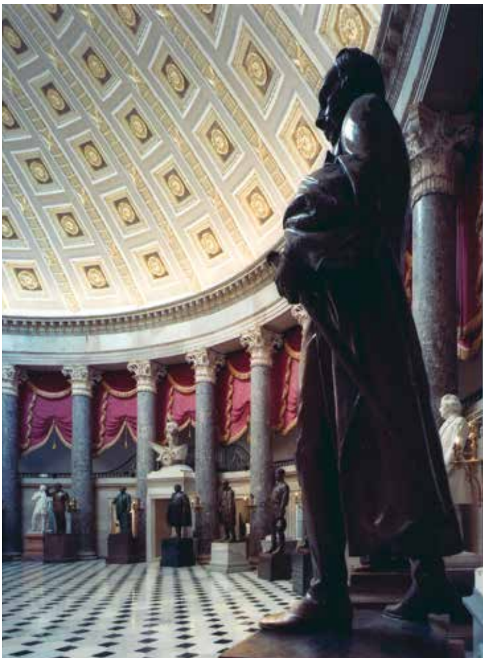
የሕዝብ እንደራሴዎች አሮጌው አዳራሽ በአሁኑ ጊዜ ብሔራዊ የሃውልቶች አዳራሽ ሆኖ ያገለግላል።

በቅርብ ጊዜ በካፒቶል ላይ የተጨመረው የካፒቶል የጎብኚዎች ማዕከል ነው፤ የተገነባው ከምሥራቃዊው ፕላዛ ቦታ ሲሆን፣ በ2008 ተጠናቀቀ። በዚህ ህንፃ ውስጥ የትዕይንት አዳራሽ፣ የማስተዋወቂያ አዳራሾች፣ ሬስቶራንት፣ የስጦታ መደብሮች፣ ከላይ-በራሪ አፍ ኮንግረስ ጋር የሚያገናኝ መተላለፊያና ካፒቶል በተሻለ እንዲያገለግል የሚያደርጉ ማሻሻያዎች ይገኛሉ።