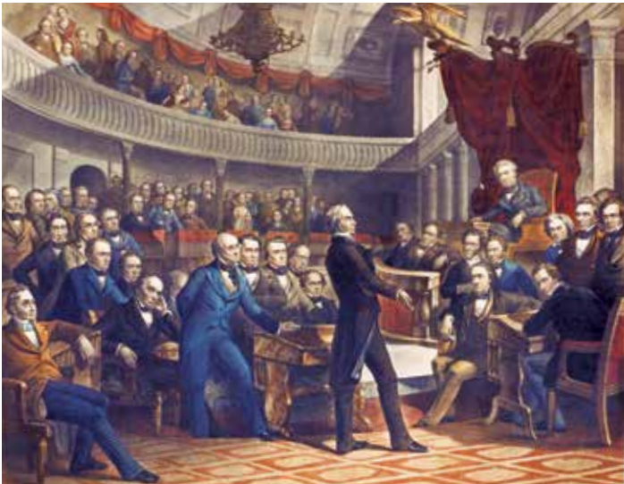
ሴኔተር ሄንሪ ክሌይ የ1850ን የማቻቻል ሀሳብ በመደገፍ በአሮጌው የሴኔት ምክር ቤት ንግግር ሲያደርግ።

በ1850 በርካታ ተጨማሪ ግዛቶች የጎበረቱ አባላት በመሆናቸው ምክንያት የሕዝብ እንደራሴዎች ምክር ቤትና ሴኔት ይጠቀሙ ከነበሩባቸው ህንፃዎች የማስተናገድ አቅም በላይ ሆነው ነበር። በቀድሞው ሕንጻ ግራና ቀኝ ታላላቅ ተቀጥላ ሕንጻዎች እንዲሰሩና ካፒቶሉ እንዲስፋፋ ተወሰነ። በ1851 በሁለቱም