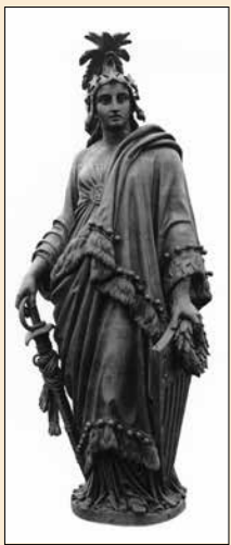
▲ በጉልላቱ አናት ላይ የነጻነት ሐውልት ቆሟል

◀ በ1861 የአዲሱ ባለብረት ጉልላት ግንባታ በሚገባ በመካሄድ ላይ ነበር። ▼ ከ1801 ጀምሮ የፕሬዚዳንቶች በዓለ ሲመት በካፒቶል ሲካሄድ ቆይቷል። በዚህ ምስል በ1925 የተካሄደው የካልቪን ኩሊጅ በዓለ ሲመት ይታያል።