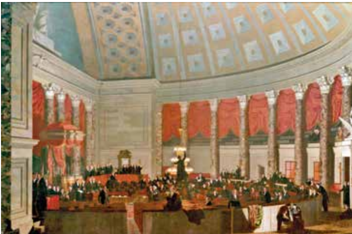
በብሔራዊ የስዕል ጋለሪ ስብሰባ የሚገኘው በሳሙኤል ሞርሰ የተሳለው አሮጌው የሕዝብ እንደራሴዎች ምክር ቤት አዳራሽ ስዕል።

የካፒቶል የስዕል ሃብቶች ወደ ቀጣዩ ትውልድ ተጠብቀው እንዲተላለፉ እገዛ ያድርጉ። እባክዎን ስዕሎቹንና ሃውልቶቹን እያያችሁ ተደሰቱ፤ ነገር ግን አይንኳቸው።