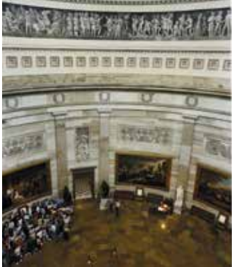
የሮተንጎው ጉብኝት ከሌሎች የካፒቶል ጉብኝት ሁሉ የላቀ ነው።

ጉብኝቶች ከክፍያ ነጻ ናቸው ሆኖም ግን የጉብኝት የይለፍ ፈቃድ ማግኘት ያስፈልጋል። በ www.visitthecapitol.gov