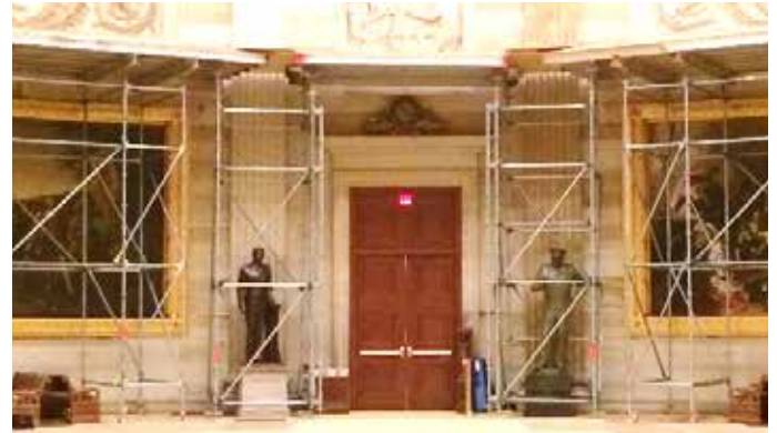
የጉልላት እድሳት ፕሮጀክቱ የተወሰነ ደረጃ ላይ ሲደርስ ወጋግራዎችና የስእል ስራዎችን ከጉዳት መጠበቂያዎች ሊደረጉ ይችላሉ።

ፕሮጀክቱ የ2017 የዩናይትድ ስቴትስ ፕሬዝዳንት የሹመት በዓል ከመድረሱ በፊት እንዲጠናቀቅ በእቅድ ተይዟል።