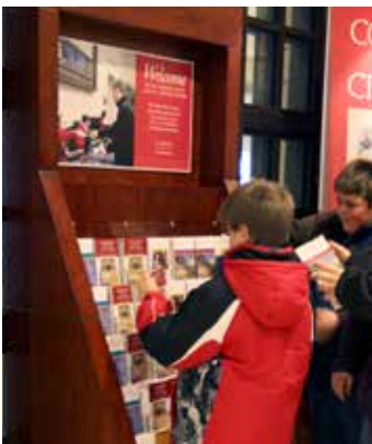
ከእንግሊዝኛ ሌላ በሆኑ ቋንቋዎች የተዘጋጁ በራሪ ጽሁፎች በጉብኝት ማእከል ይገኛሉ።