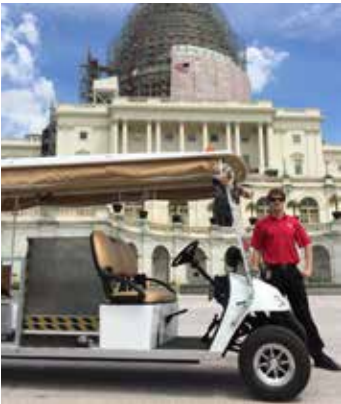
ካፒቶል ባረፈበት ምድር ሁሉ በቀላሉ መንቀሳቀስ ለማይችሉ ወይም በእጅ በሚገፉ ተሽከርካሪ ወንበሮች ላይ ሆነው ለሚዘዋወሩ ሰዎች የሚሆን የማመላለሻ አገልግሎት አለ።