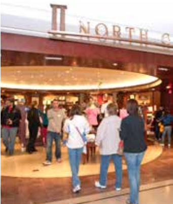
በጉብኝቶች ማእከሉ የላይኛው ደርብ ላይ ሁለት የስጦታ እቃ መሸጫ መደብሮች ይገኛሉ።

ወደ ካፒቶል የጉብኝቶች ማእከል ከመግባትዎ አስቀድሞ ሁሉም ጉብኝቶች በማግኒቶማትር የሚፈተሹ ሲሆን በህንጻው ውስጥ ይዘው ሊገቡ የሚፈቀድልዎት እቃዎች በሙሉ በኤክስሬይ መሳሪያ ይታያሉ። እባክዎ በገጽ 5 ላይ በሳጥን ያለውን ወይም የተከለከሉ እቃዎች የሚለውን ይመልከቱ።