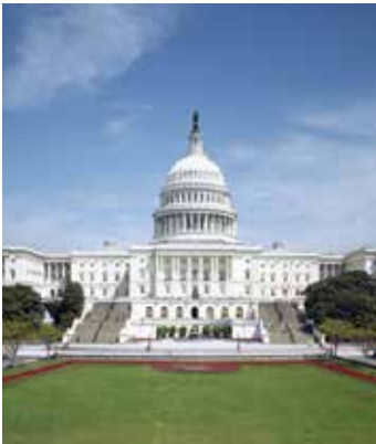
የካፒቶል የምእራብ አካል ፊት ወደ ናሽናል ሞል በኩል ነው።