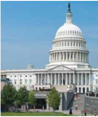
የካፒቶል የጉብኝት ማእከል ወደ ዩኤስ ካፒቶል የሚያስገባ ዋናው መግቢያ ነው።