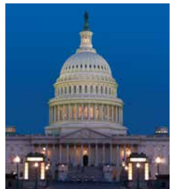
የዩናይትድ ስቴትስ ካፒቶል

ኮንግረስ የፌዴራል መንግስቱ ህግ አዉጪ ቅርንጫፍ ነው ይህም የአሜሪካንን ህዝብ በመወከል ሀገሪቱ የምትተዳደርበትን ህግ ያወጣል። በመሆኑም በፕሬዚደንቱ ከሚመራው የስራ አስፈጻሚ አካልና የዩናይትድ ስቴትስ ጠቅላይ ፍርድ ቤት ከፍተኛ አካሉ ከሆነው ከህግ አስፈጻሚው አካል ጋር ስልጣን ይጋራል። ከሶስቱ የመንግስት አካሎች ውስጥ በቀጥታ በህዝብ የሚመረጥ ኮንግረስ ብቻ ነው።