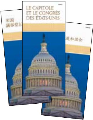
ከእንግሊዝኛ ውጪ በሆኑ ቋንቋዎች የተዘጋጁ የፕሮሜኔሪዎች ፋይሎች ከድረ ገጽ ላይ www.visitthecapitol.gov/brochures ማወረድ ይችሉ ይሆናል።