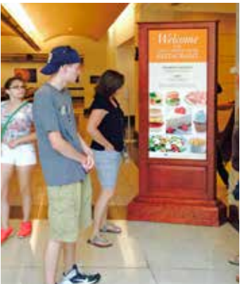
ሬስቶራንቱ በጉብኝቶች ማእከሉ የታችኛው ደርብ ላይ ይገኛል።