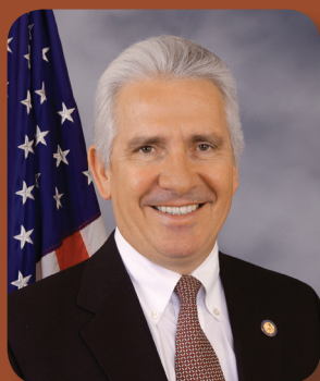
United States Representative Jim Costa

Fresno Office 855 M Street, Suite 940 Fresno, CA 93721 Phone: 559-495-1620 Fax: 559-495-1027