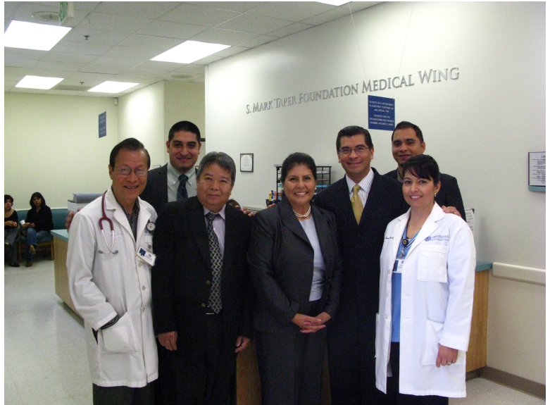
Rep. Becerra visita con los empleados de Arroyo Vista Family Health Centers en Lincoln Heights después de una reunión sobre el impacto local de la reforma de la segura médico.

Recibió más de $3.5 millones para proseguir con investigaciones sobre las causas y curas potenciales para una variedad de enfermedades del oído. Esta investigación excitante puede resultar en nuevas terapias para personas con problemas auditivos.