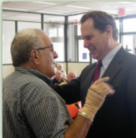
El Congresista Lincoln Díaz-Balart durante un taller sobre la ley de estímulo económico que ofreció a las personas de la tercera edad ayuda gratuita para llenar las planillas necesarias para beneficiarse de la Ley de Estímulo Económico