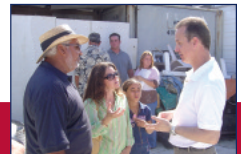
El Congresista Mario Díaz-Balart evaluando los daños ocasionados por el huracán con las autoridades locales.