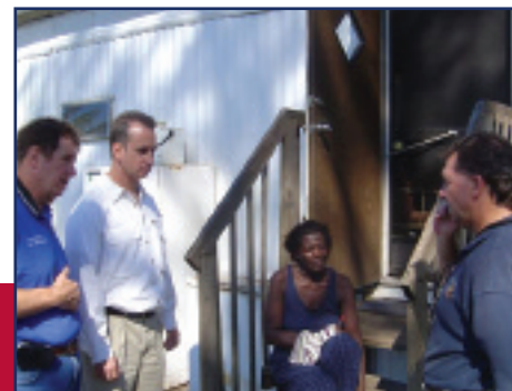
El Congresista Mario Díaz-Balart evaluando los daños ocasionados por el huracán con las autoridades locales.