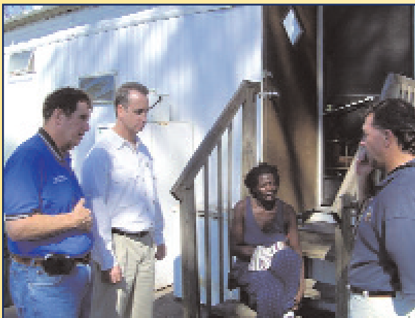
El Congresista Mario Diaz-Balart evaluando los daños ocasionados por el huracán con las autoridades locales.